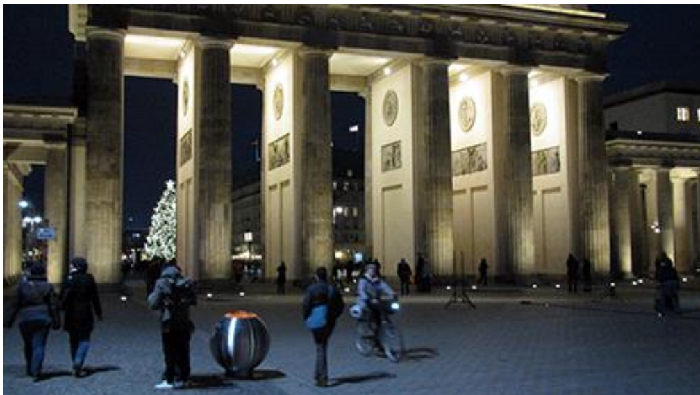
De Bubble voor de Brandenburger Tor in Berlijn

Groot volume vervangt meerdere kleinere afvalbakken: minder zwerfvuil en minder legingen.